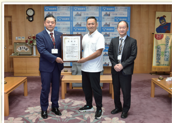
応援をいただきました 7月6日(火)、いば青果さんより、ウガンダ共和国代表選手団応援のため、選手団のみなさんにパイナップルを寄贈いただきました。