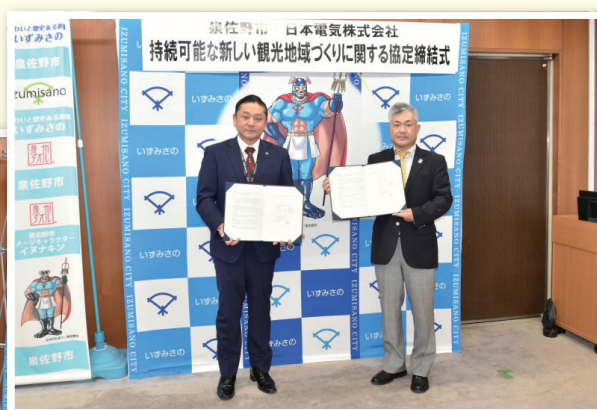
府内初!!観光地域づくりに関する連携協定を締結 7月9日(金)、日本電気株式会社と観光分野における行動データの利活用による地域観光の活性化を目的に、持続可能な新しい観光地域づくりに関する連携協定を締結しました。この第一弾として、シェアサイクルとその位置情報を基に、観光の課題解決を図る実証実験を実施します。