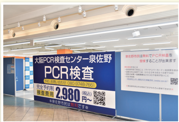
りんくうタウンでPCR検査センターがオープン 7月12日(月)、りんくうタウンにおいて症状のない市民が無料で検査を受けることのできる民間PCR検査センターがオープンしました。受検方法などについて、詳しくは広報7月号をご覧ください。