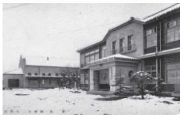
▲南海「泉佐野」駅前にあった第二小学校

場所・申込・問合せ 9月7日(火)以降に電話、FAXで佐野公民館(☎463・6181 Fax469・2243)へ。キャンセルは9月28日(火)まで ※受講無料