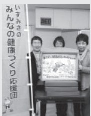
現在のメンバーは15人です。ぜひ一緒に活動しましょう。

市民のみなさんの健康を応援するグループです。地域に代わって手作りの紙芝居で介護予防の大切さを、がん検診時に腹囲や体脂肪測定で肥満予防の大切さを呼びかけています。