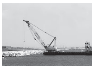
▲消波ブロック設置