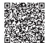
▲アンケートQRコード

問合先 泉州南広域消防本部 警防部 予防課（☎469・0886 Fax 460・2119） ※住宅用火災警報器のアンケート調査にご協力ください。