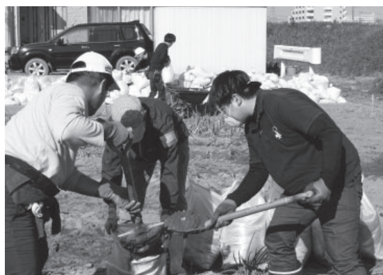
◀災害ボランティア活動の様子