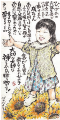
▲一般の部最優秀賞

入賞・入選作品のみの展示になります。 日時 3月17日(木)～21日(祝) 午前10時～午後5時 場所 エブノ泉の森ホール ギャラリー 主催 泉佐野市教育委員会 問合せ先 NPO法人 泉州佐野にぎわい本舗 (☎468-6665) ※入場無料。新型コロナウイルス感染症拡大防止のため、交流会は中止となりました。