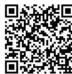
▲大阪依存症包括支援拠点 QRコード