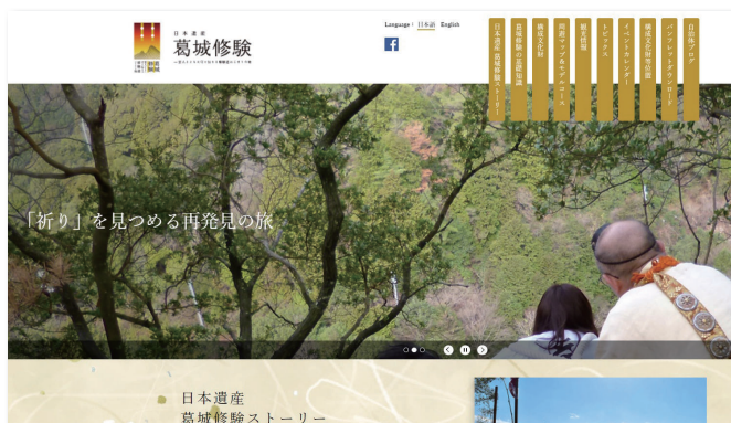
葛城修験 - 里人とともに守り伝える修験道はじまりの地 公式ウェブサイト https://katsuragisyugen-nihonisan.com/

※「北前船」および「葛城修験」については、日本遺産に認定された自治体で構成されたホームページ内に、本市の情報が掲載されています。