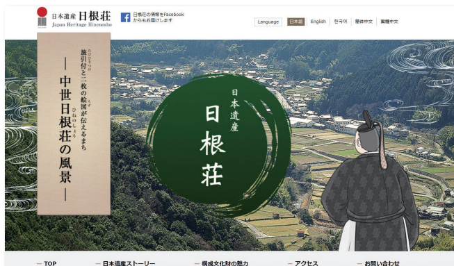
「日本遺産 日根荘」特設サイト https://hinenosho.jp/

本市の3つの日本遺産について、それぞれホームページで詳しく紹介されていますので、ぜひご覧ください。