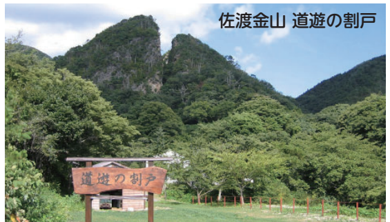
佐渡金山 道遊の割戸