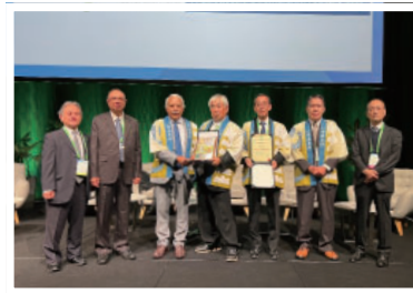
▲井川用水認定式の様子

井川用水は約800年前から存在するかんがい用水路であり、日本国内において、現在も利用されている農業用水路で、国の史跡に指定されているのは井川用水だけであり、中世からの開墾の歴史を知ることができる貴重な遺産となっています。