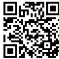
▲泉佐野観光 ボランティア協会