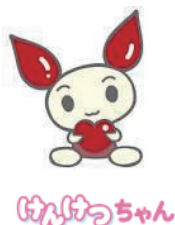
ひきこもりちゃん

申込・問合せ 2月27日(月)以降に泉佐野保健所 精神保健福祉チーム(☎462・4600)へ