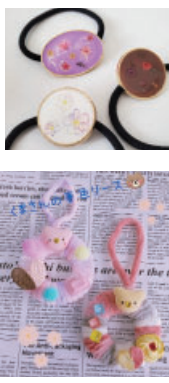
▶レジンアクセサリー ▶スイーツデコ