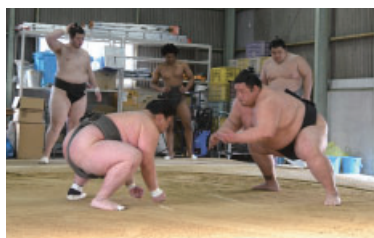
▲雷部屋のみなさん(前列中央:雷親方)