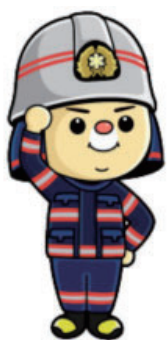
▲マスコットキャラクターせん助

規約を確認のうえ、登録申請書をダウンロードし、直接またはFAX、eメールで泉州南広域消防本部 救急課 (☎463-5111 Fax460-2119 eメール: kyukyu@senshu-minami119.jp) へ