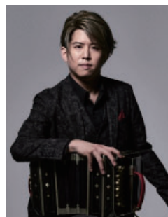
▲三浦一馬

※未就学児の入場はご遠慮ください。前売券が完売の場合、当日券の販売はありません。本コンサートは(公財)三井住友海上文化財団の助成により特別料金に設定しています。