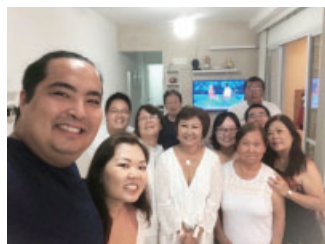
▲ブラジルにいる家族

12月で泉佐野市に来てから6ヵ月になりました！この6ヵ月でいろいろな経験をして、良い思い出をたくさん作りました。その中で、夏にゆかたを着たり、祭りに行ったり、たこ焼きを食べたり、紅葉を見たり、旅行したりしました。日本の文化や行事を体験できました。