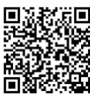
▲電子申告はこちら

■ 令和8年度分より、マイナンバーカードを使用した市・府民税の電子申告が可能となりました。