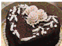
▲写真はイメージです