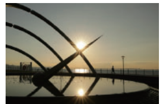
※写真は昨年度受賞作品