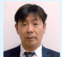
政策監(兼) 市長公室長 河野陽一