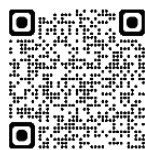
▲HIV検査情報リサーチ

し、もし結果が陰性でも、正確な結果を確認するために、感染の機会から3カ月以上経ってから再度検査を受けることをお勧めします。HIV検査は、検査施設によって実施している検査の種類や日時が異なります。また一部の検査施設では、事前予約が必要な場合がありますので、まず「HIV検査情報リサーチ」などで検索してみてください。