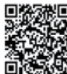
▲年度更新申告書 書き方パンフレット