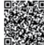
▲労働保険電子申請 特設サイト