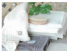
泉佐野市特産品 「泉州こだわりタオル」