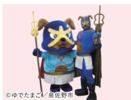
泉佐野市公式キャラクター 「イヌナキン」&「ゆるナキン」