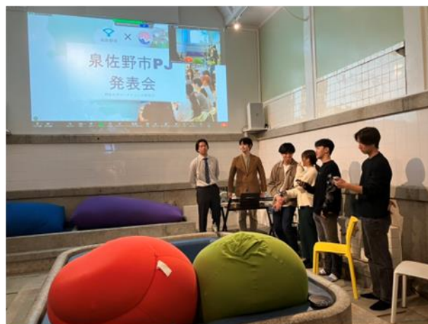
※11月の泉佐野ローカルインターンの様子