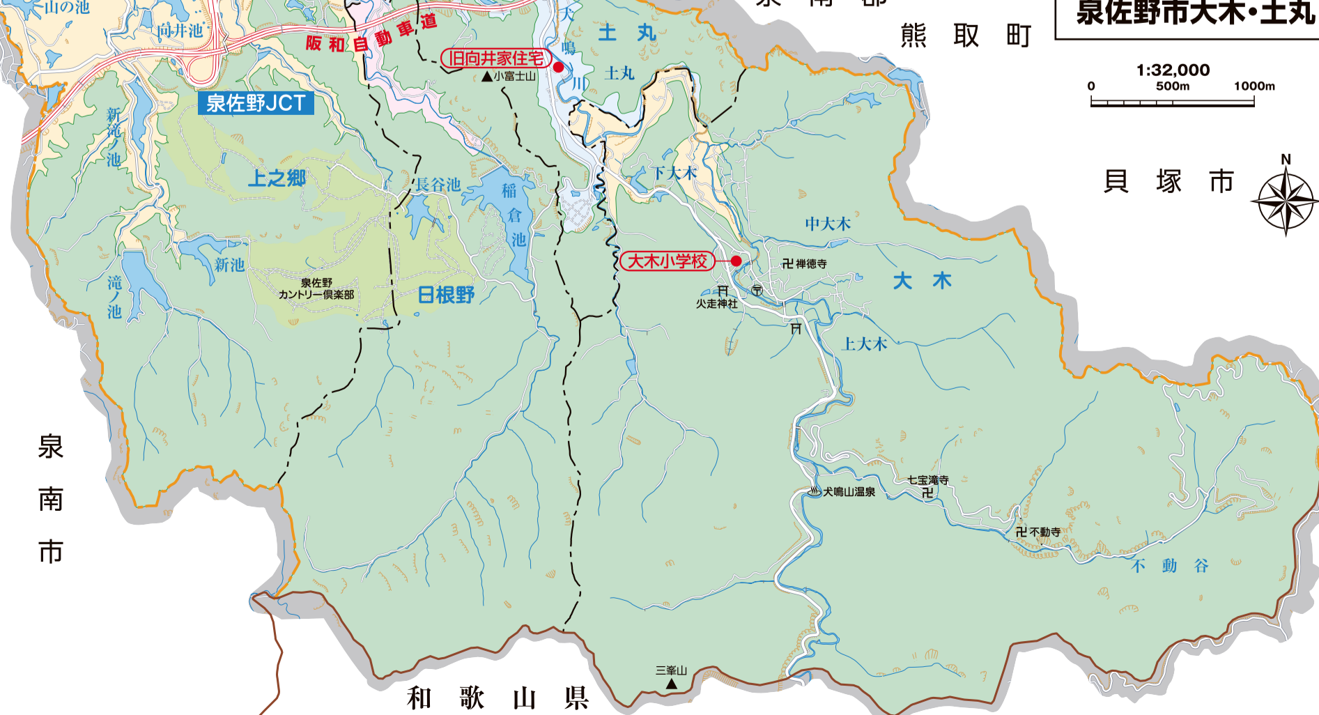
泉佐野市大・土丸