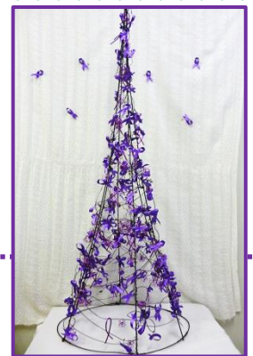
パープルリボンツリー

例えば、子育てがひと段落ついて、再就職をお考えの方、ハローワークに行く前のちょっとした情報収集に、女性センターをご利用ください。