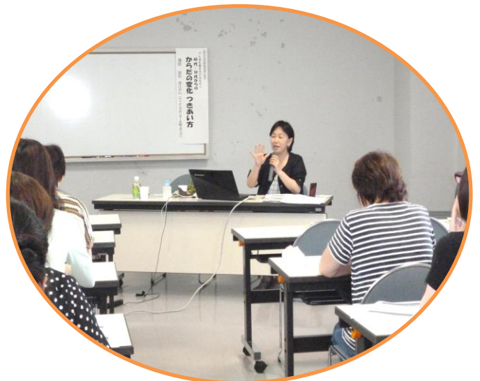
からだの変化 つきあい方のセミナーの様子