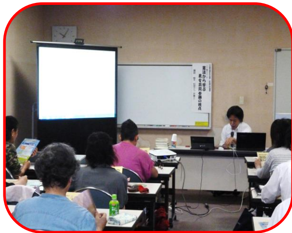
憲法週間記念市民講座・くらし塾セミナー②の様子