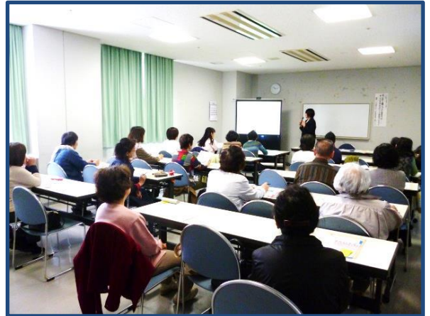
くらし塾セミナー①の様子