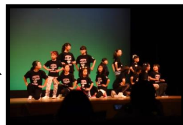
ヒップホップダンスの様子