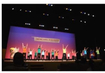
みんなでダンス「世界で一つだけの花」の様子