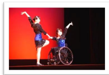
車いすダンスの様子

新たなメンバーを加えたダンス講座生たちは、歌の歌詞にある「それなのに僕ら人間はどうしてこうも比べたがる？一人ひとり違うのにその中で一番になりたがる？」や「小さい花や大きな花一つとして同じものはないから No. 1にならなくてもいいもともと特別なOnly one」のように「みんな、同じでなくてもいいんだよ。違っていてもいいんだよ。」というメッセージを込めて踊りました。