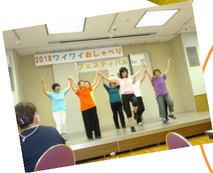
さくらダンス「世界に一つだけの花」

いずみさの女性センターに登録するグループ(通称IWN)による年1回のフェスティバルを開催しました。これからも男女共同参画社会を実現するために、みなさまといっしょに力を合わせて歩み続けていきたいという思いから、今年のテーマは「カ」でした。グループの活動報告やミニミニシアターのほか、今年は20回目を迎え朗読劇を行い、楽しい時間を過ごしました。フィナーレでは、今年度から加入した「さくらダンス」のみなさんと参加者全員で「世界に一つだけの花」を踊りました。