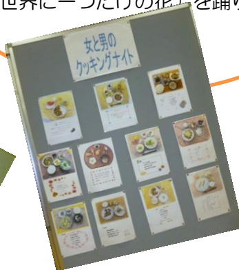
料理グループ「女と男のクッキングナイト」レシピ

♪ IWN グループは… いちよう句会 ウィークエンドサロン NPO 法人ウィズ生活支援センター エンパワーズ 女と男のクッキングナイト さくらダンス NPO 法人保育サポーターグループ・チョコキ・パーグループ「てる」