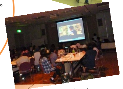
ミニミニシアター