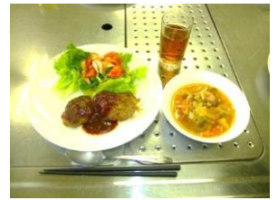
いずみさの女性センターに登録している自主グループ(エンパワーズ)の活動に参加しました。

慣れない場所で不安や緊張もあったと思いますが、礼儀正しく、真摯に仕事に向き合ってくれた姿勢が印象深くうれしかったです。