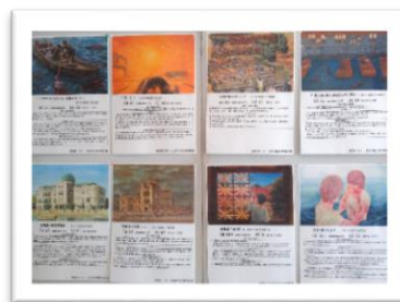
「被爆の絵」の複製画

最後に今のアメリカにも「黒人差別の歴史」を自虐史観だとし、差別をなくす運動を抑制しようとする動きがあることを紹介されました。アメリカでの黒人差別との闘いはずっと続いているのです。日本もアメリカも差別や人権について、同じ問題を抱えていると思いました。