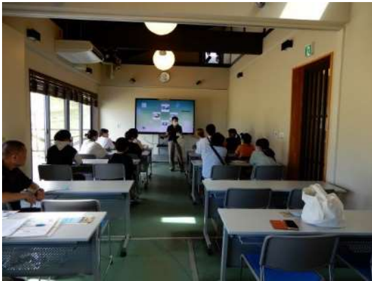
昼食後は五斗長垣内遺跡にて歴史の勉強をしました。