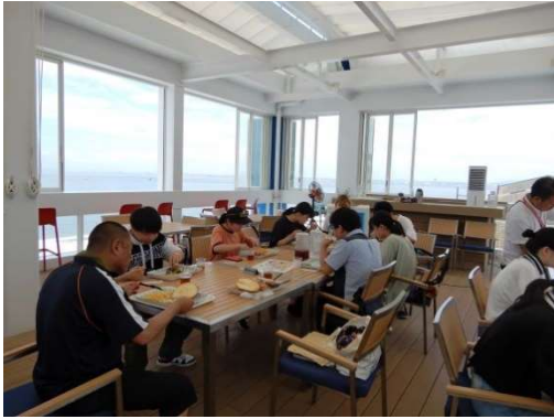
クラフトサーカスにて昼食。 びっくりサイズのハンバーガー。