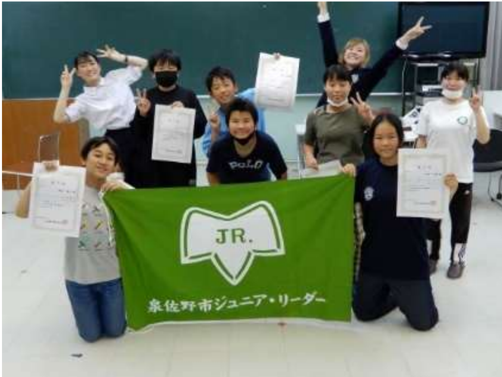
みんなで無事終了しました。がんばりました！