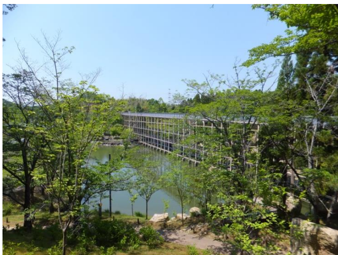
紅葉谷を進むと、観月橋のたもとに出ました。