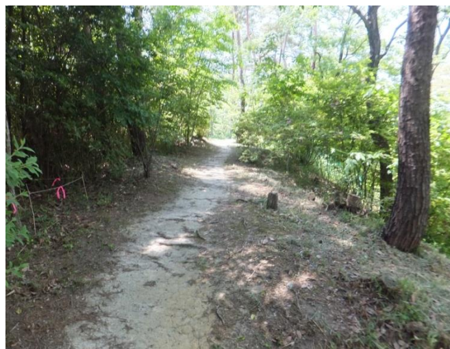
13時15分 さえずりの道を歩きました。