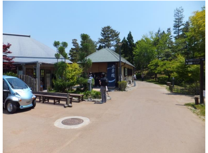
11時15分 水景園入口に到着。