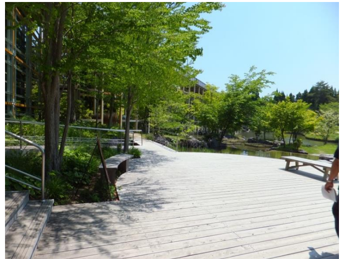
11時50分 観月楼前テラスに到着。

気温が 30℃になる予想でしたので、クーラーのある部屋を準備確保しました。1号車の参加者の皆様はビジターセンターの会議室で、2号車の皆様は観月楼の会議室で食事をして頂きました。