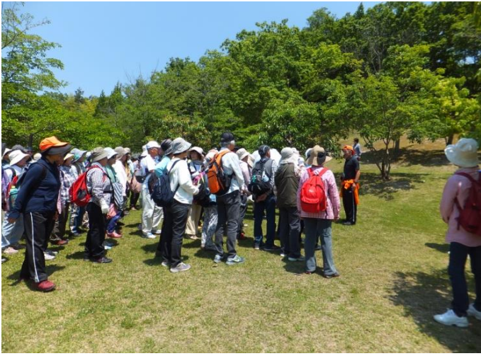
11 時 00 分 けいはんな記念公園広場集合