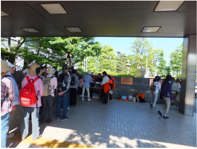
8 時 30 分市役所前で参加者受付開始

コース 市役所→けいはんな記念公園 広場→水景園→森のバリアフリールート(里棚田・森の出入口・山棚田水辺の小道)→観月楼・昼食(1号車ビジターセンター・2号車観月楼)→山沿いに歩く午後のハイキングコース(紅葉谷・巨石群・さえずりの道・水辺の小道・カキノキ峠・竹林)→観月楼→観月橋