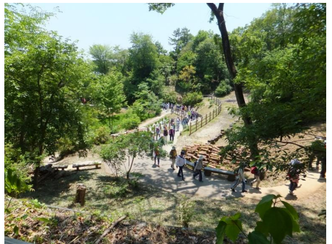
11時25分 山棚田から森の出入口へ。