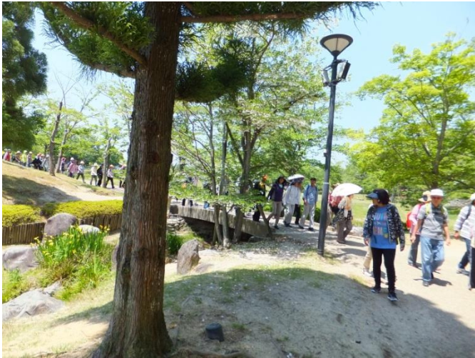
広場から水景園へ。