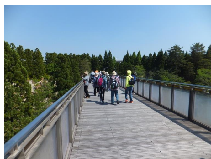
14時00分 観月橋を渡りました。