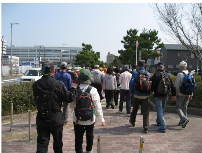
空連道に向かって進む。