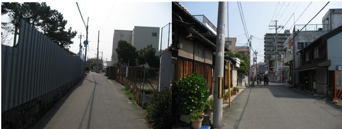
第1小学校前に行く。お寺の前を通過して、更に進むと旧紀州街道に出る。左折し、街道を行く。