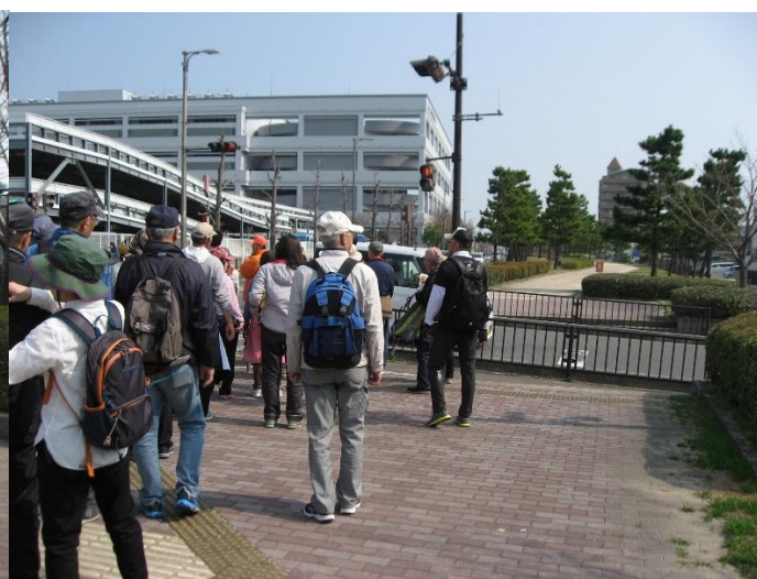
少し行くと空連道大阪側交差点に到着する。ここで4 Km コースが終了になる。