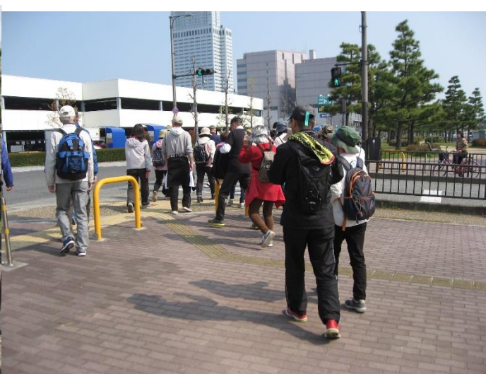
りんくう中央公園南側に行く。