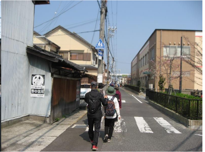
進んで行くと三叉路に行き当たる。左折して浜側に向かって進む。