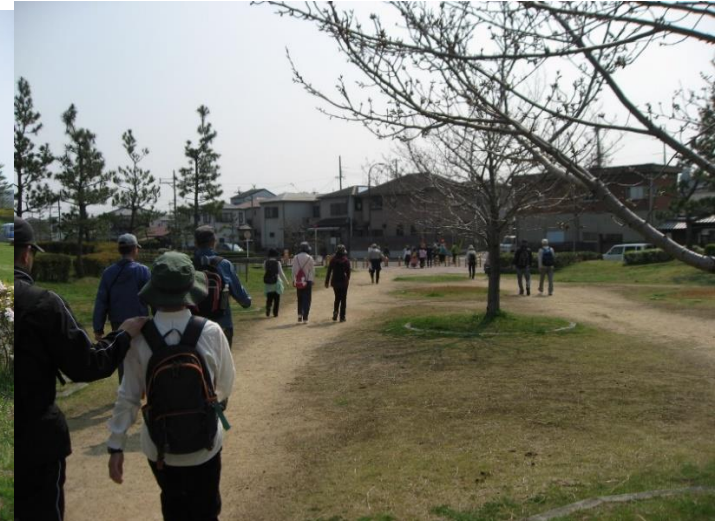
りんくう緑地遊歩道を更に進み、りんくう緑地野出町の北端を右折する。