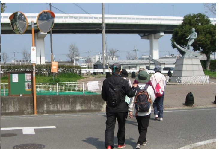
更に進むと、突き当たりの場所に青銅製漁師のモニュメントがある。そこから緑地遊歩道に入る。