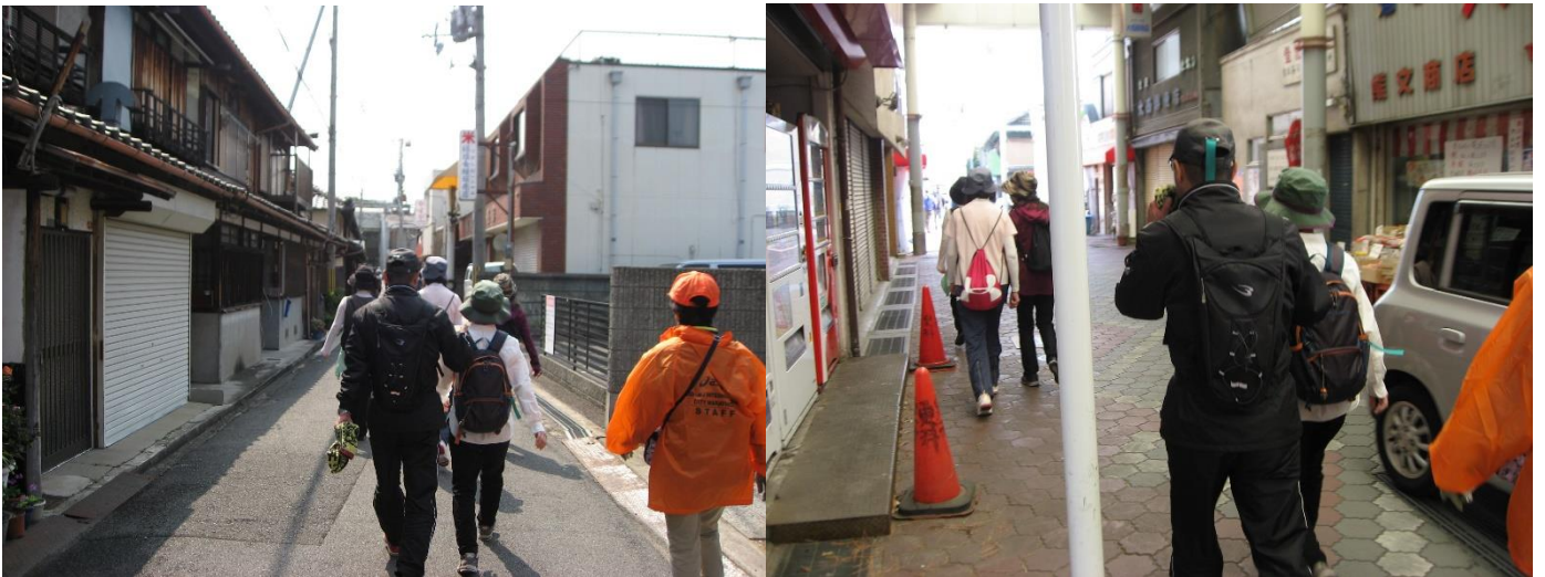
T 字路を右折して進むと、つばさ通りに出る。左折してつばさ通りを進む。