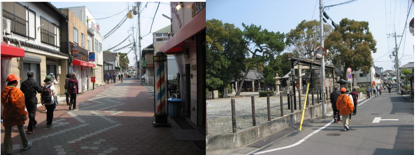
つばさ通りを通り抜け、少し進むと春日神社に着く。更に大阪側へ向かって進む。