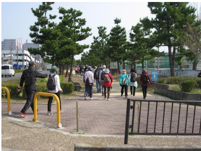
りんくう中央公園南外周に行く。