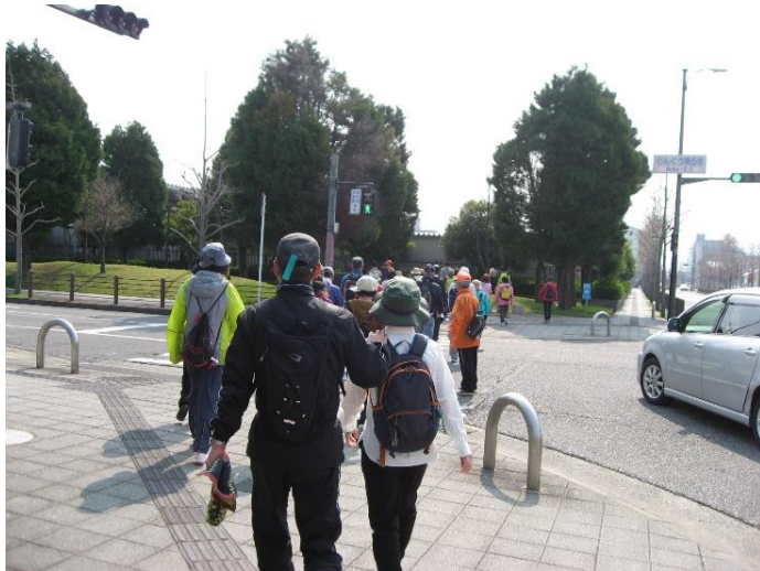
東側に行き、車道を渡り、りんくう中央公園へ向かう。