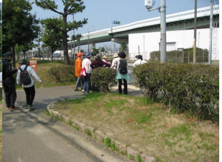
左折し緑地遊歩道を和歌山方向へ進む。青空市場前交差点を横断する。