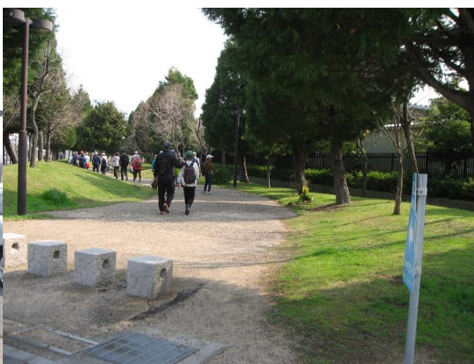
りんくう中央公園の外周を進む。