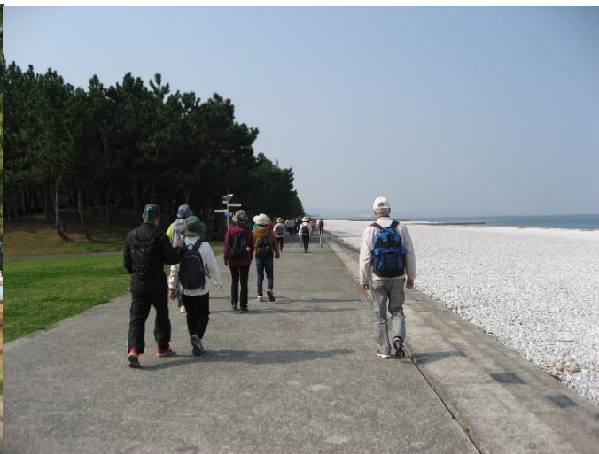
マールビーチに行く。