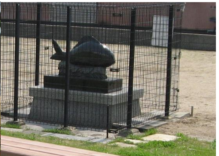
更に進むと鯛の石像が緑地内に建てられている。