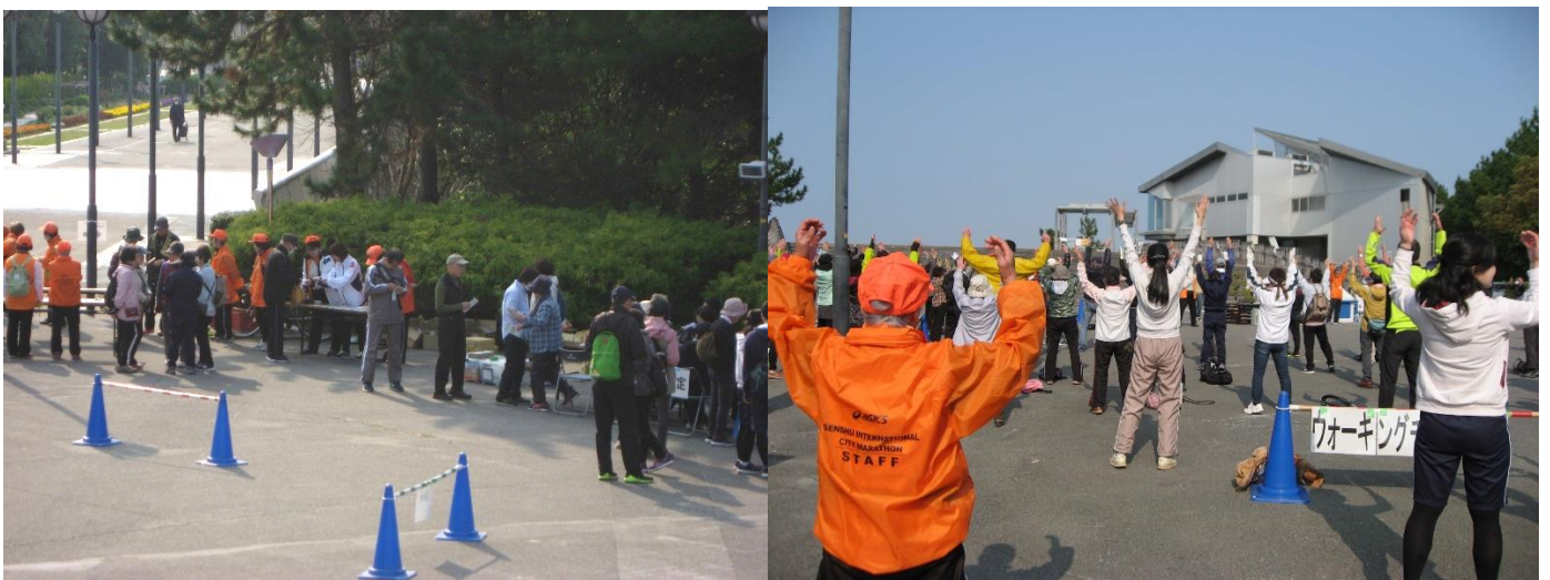
平成30年3月25日 8時30分受付開始