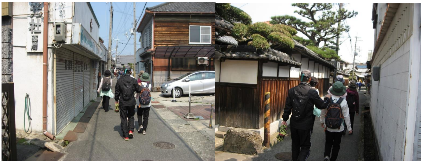
浜側へ向かって進む。指定文化財旧新川家ふるさと町屋館の表示があり、右折する。