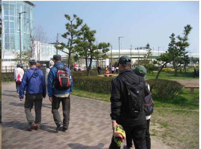
りんくう緑地笠松を大阪方向へ進む。