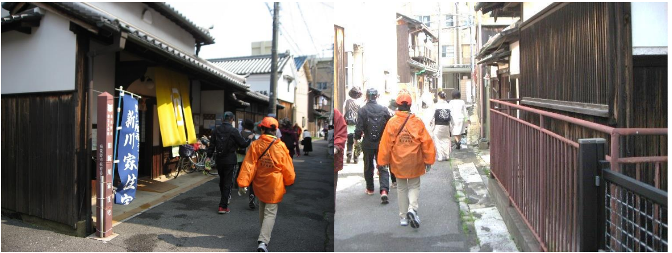
ふるさと町屋館を通過、更に進むと T 字路に突き当たる。右折する。