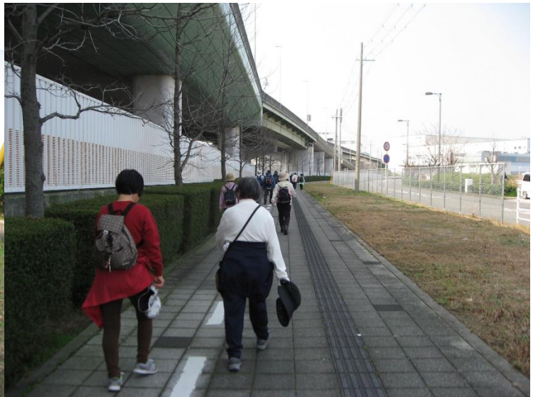
阪神高速道路高架下の歩道をゲートタワーに向かって進む。