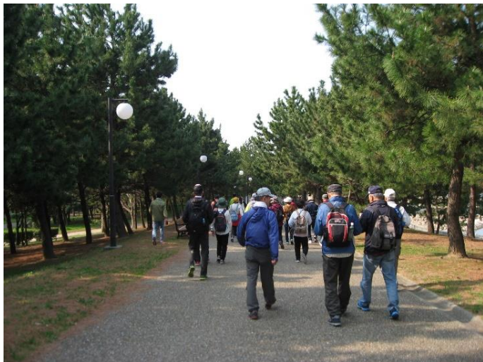
りんくう公園を和歌山方向へ行く。

コース概要 りんくう公園→マールビーチ→りんくう中央公園→緑地遊歩道→空連道大阪側交差点