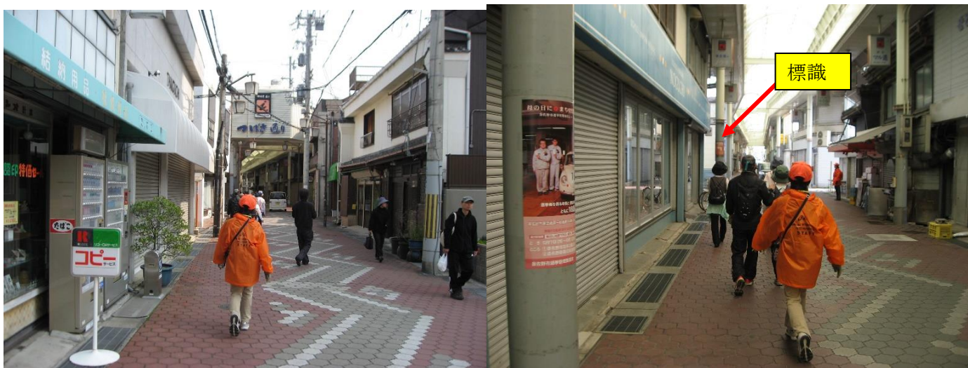
つばさ通りに入り、少し行くと右手電柱に「ツール・ド・大阪」の標識があり、左折する。