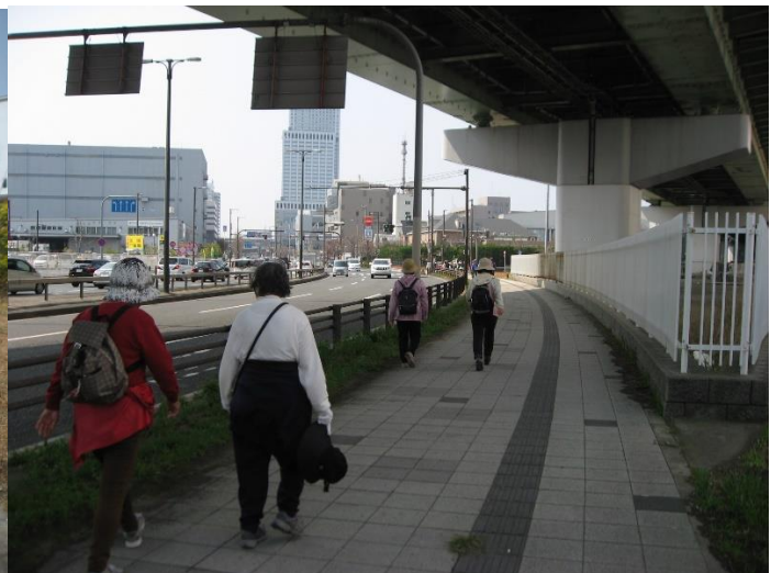
更に進み、阪神高速道路高架下を渡って行く。