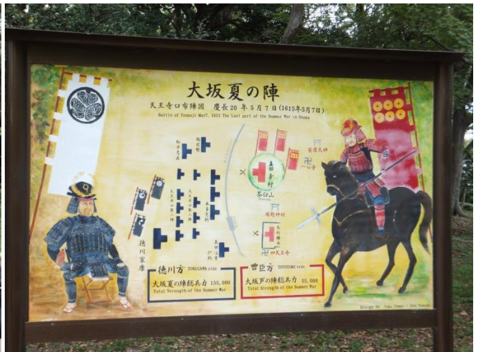
大坂の陣史跡：茶臼山の石碑横の道を登って、頂上へ。そこから1段下った所に、大坂夏の陣の説明板があった。その場で小休止です。