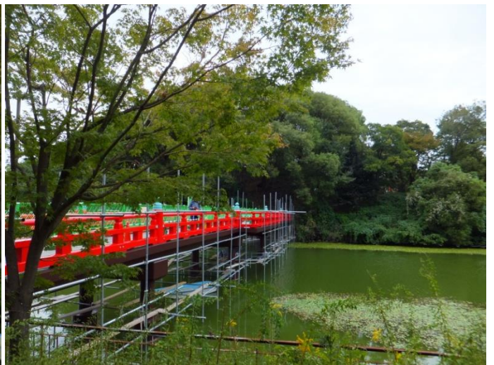
美術館前を通り、池の外周を通って、茶臼山へ登って行く。