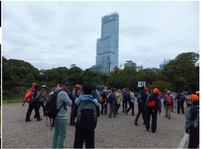
庭園を1周してから、あべのハルカスを背景にして、記念撮影する。