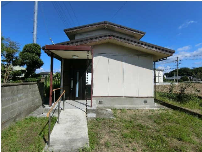
物件画像・間取画像