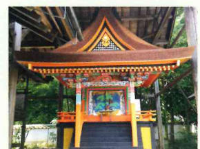
火走神社摂社幸神社本殿