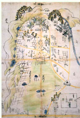
日根野村荒野開発絵図