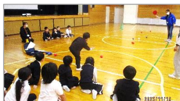
11/19 1年生ボッチャ体験