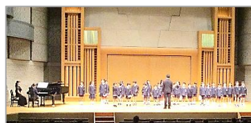
11/6 3年生市連合音楽会