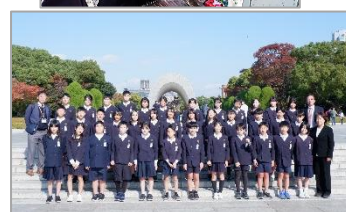
修学旅行（平和記念公園にて）