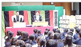
11/10 5・6年生落語・講談出前授業