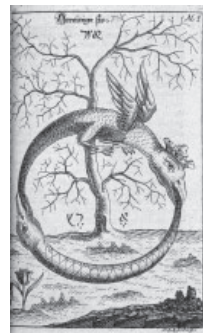
▶ラビ・アブラハム・エレアツァール「太古の化学作業」(1735年) 大英図書館蔵