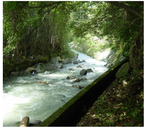
しょうぶい 菫蒲井