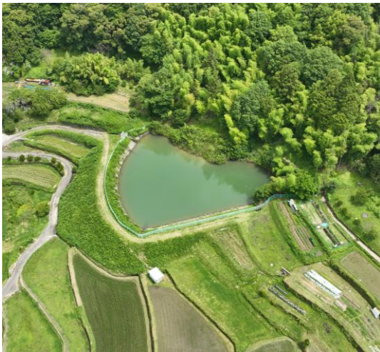
ひがしのいけ 東ノ池

日根 荘 成立に伴って実施された調査記録に残る水路の一部は、今もその姿を見ることができ、古い時代の水利利用の形が現在まであまり崩されずに継承されています。