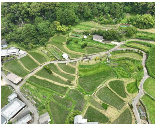
ひがしのいけ たなだ 東ノ池の棚田