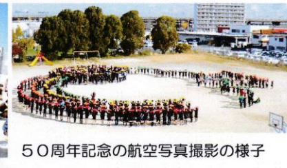
50周年記念の航空写真撮影の様子