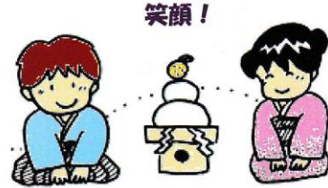
明けまして、おめでとうございます。

本日、始業式を行い、3学期がスタートしました。2年連続のコロナ禍での年末年始となりましたが、新しい年をどのように迎えられましたか。令和4年が児童・保護者・地域の皆様をはじめ、関係するすべての皆様にとりまして、幸多き年となりますよう、ご祈念申し上げます。本年も、どうぞよろしくお願ひいたします。