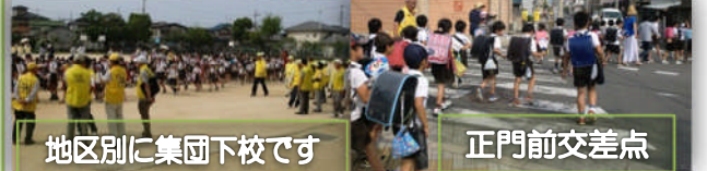
地区別に集団下校です