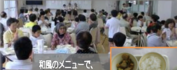
和風のメニューで、喜んでいただきました。

6月18日(木)地域のお年寄りの方々と4年生1組が、一緒に給食を食べて交流しました。交流会の準備や片付けなどは、4年生全体で取り組みました。