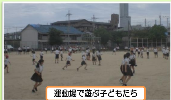
運動場で遊ぶ子どもたち

児童のみなさんは、学期中の生活リズムを保ちながら夏休みを過ごし、2学期も良いスタートを切ってほしいと思います。