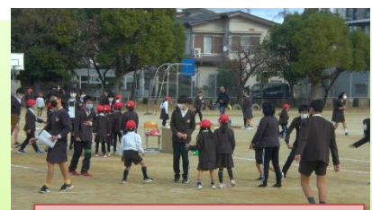
1年生と6年生(外遊び)