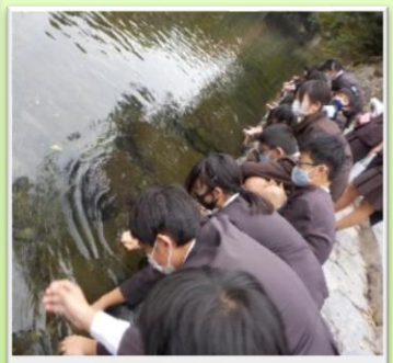
伊勢神宮 五十鈴川