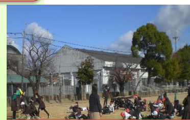
3年生と4年生(外遊び)