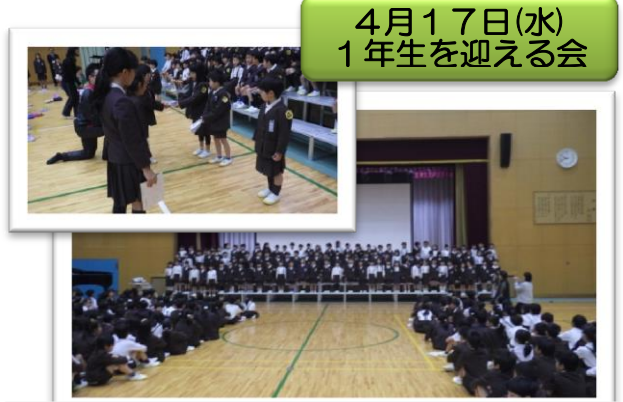
4月17日(水) 1年生を迎える会

町会・子ども会・福祉委員会・民生児童委員さんなど、地域の力が、学校の応援団として活動していただけることに感謝いたします。今後ともよろしく願います。