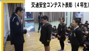
交通安全コンテスト表彰(4年生)

第3回市内一斉パトロールを開催しました。登校時の見まもり活動をしてくださっている地域の皆様も参加いただきPTAと一緒に歩いていただきました。ありがとうございました。