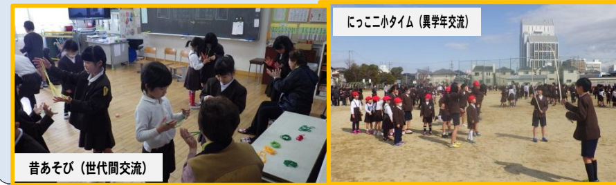
にっこ二小タイム(異学年交流)

2月に行われた二つの行事で、お昼休みに実施した「にっこ二小(にこ)タイム(異学年交流)」と土曜授業に実施した「昔あそび(世代間交流)」がありました。にっこ二小タイムでは、6年生が1年生をおんぶして大縄を跳んでいました。昔あそびでは、地域のお年寄りの方々から一生懸命教えてもらう1年生の姿が見られました。どちらも、同じ年齢の中で暮らしているだけでは体験できない学びです。他者を思いやる優しい心の育成にもつながります。大切にしたい行事です。