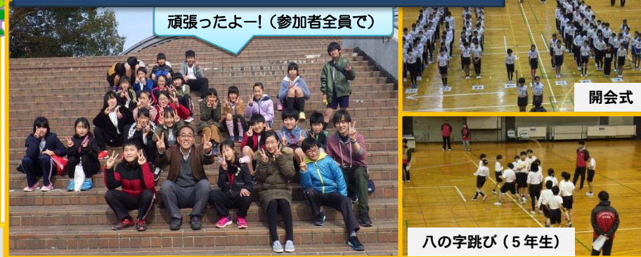
頑張ったよー!(参加者全員で)