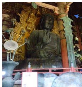
5年生 東大寺、平城京跡