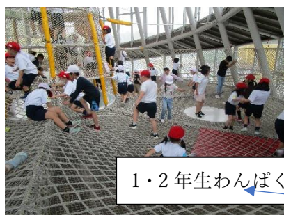
1・2年生わんぱく公園

5月19日(金)にバスで遠足に出かけました。残念ながら雨模様の遠足となり、見学や活動、移動に濡れてしまうという不快さをもたらされましたが、子どもたちはお友だちと非日常を楽しんでいたようで、このような校外学習の機会も同級生同士、語り継ぐことのできる思い出になるのだろうなあと、感じたところです。風邪などひいてしまわないかと心配しましたが、ご家庭でサポートしていただいたようで、ありがとうございました。体調がくずれた人も、早めに回復してください。早朝よりお弁当の準備等、ご協力をありがとうございました。