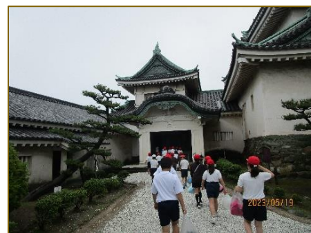
3・4年生和歌山城、こども科学館