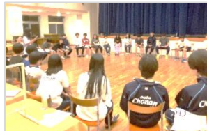
クラスミーティング