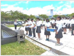
平和祈念公園（平和メモリー）