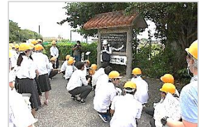
糸数アブチラガマ