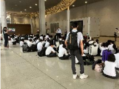
出発式（関西国際空港）

本校では修学旅行において、人権学習の一環として「反戦平和学習」を取り入れてきました。毎年沖縄戦についての学習を行っていることもあり、昨年度より行き先を沖縄方面としました。本年度は6月8日（木）から10日（土）の3日間で実施したところ、梅雨にもかかわらず天候に恵まれ予定通り過ごすことができました。平和学習、クラスミーティング、マリン体験、民泊、美ら海水族館見学、国際通り散策と有意義な3日間となりました。