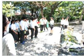
ひめゆり平和祈念資料館