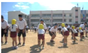
1年こども園とのダンス