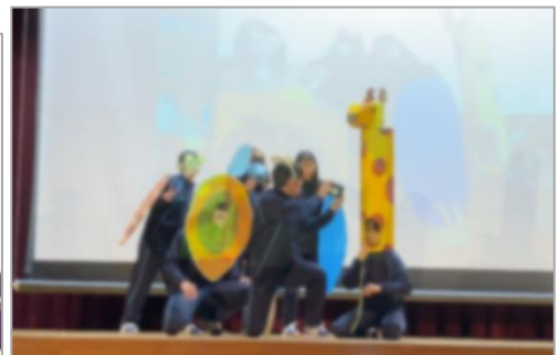
舞台発表のようす