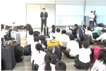
出発式（関西国際空港）

沖縄では梅雨の時期ということもあり、残念ながら3日間ともあいにくの天気で、楽しみにしていた「マリン体験」が中止（当日、雷注意報が発令されたため）となるなど、行程の変更もありましたが有意義な3日間となりました。