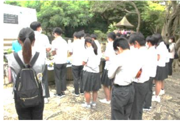
ひめゆり平和祈念資料館