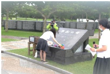
平和祈念公園（モニュメント贈呈）