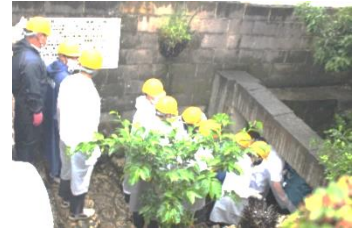
糸数アブチラガマ