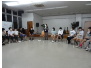
クラスミーティング